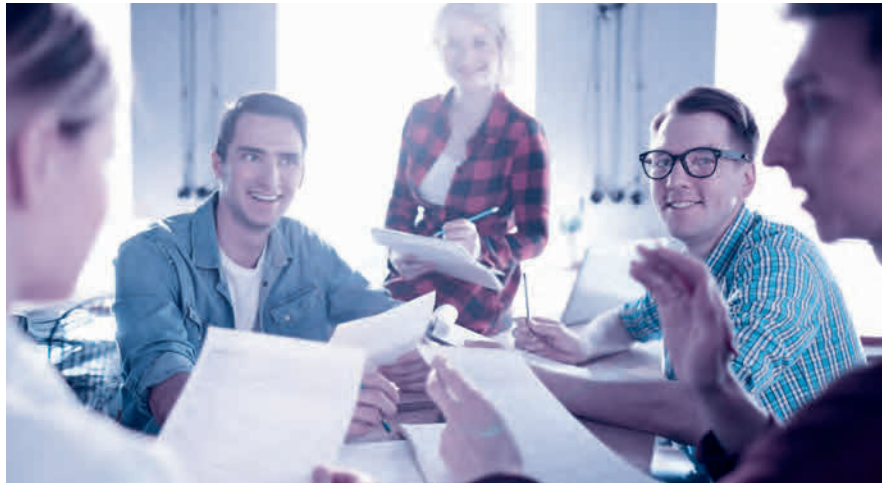
Aktionärsbindungsvertrag: ein sinnvolles Instrument, um in guten Zeiten vorausschauende Regelungen für schwierige Phasen zu definieren.

Fast alle Aktionärsbindungsverträge sehen Veräusserungsbeschränkungen vor, gerade in Familienbetrieben und Aktiengesellschaften mit wenigen Aktionären. Beispielsweise erwirbt man mit einem Kaufrecht das Recht, Aktien zu erwerben, ohne dass die Zustimmung der anderen Partei erforderlich wäre. Das kann sinnvoll sein, wenn ein Unternehmensaktionär bei der Gründung nicht das ganze Aktienkapital aufbringen kann, aber später den Anlegeraktionär auskaufen will. Vorhandrechte wiederum verpflichten dazu, seine Aktien der anderen Partei anzubieten, bevor ein Vertrag mit einem Dritten abgeschlossen wird. Ein Vorkaufsrecht berechtigt dazu, anstelle eines Dritten zu den Konditionen,