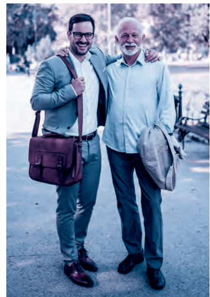
Finanzierung nach dem Umlageverfahren: zuerst einzahlen, später beziehen.